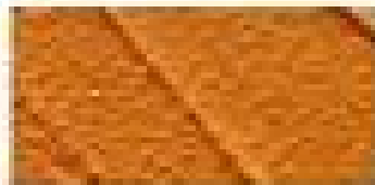
Terre du Kenya