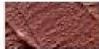
Terre de Mombassa