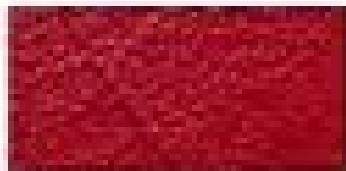
Terre rouge du Maroc